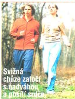
Svižná chůze zatoučí s nadváhou a posílí srdce

před jednou z nejrozšířenějších civilizačních chorob.